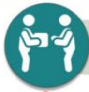
ตัวอย่างบัญชีวัสดุ